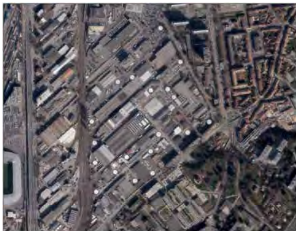
Les cercles gris représentent différents emplacement potentiels