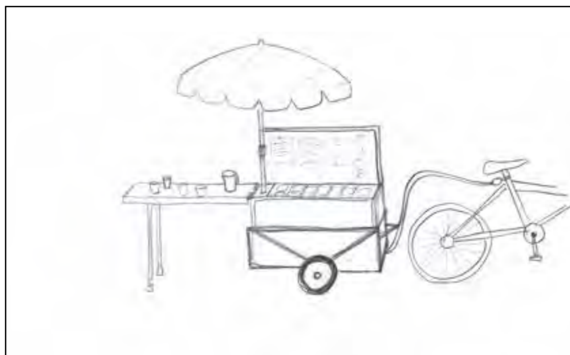
Ce à quoi ressemblerait la charette information