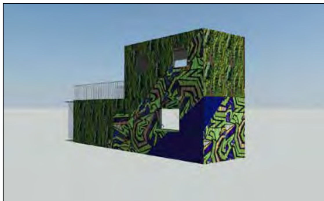
Simulation des façades Nord et Ouest