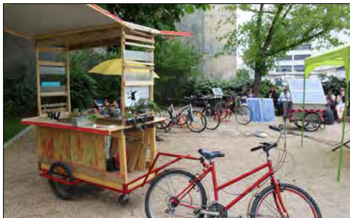
https://jardiniersavelo.wordpress.com/notre-equipe/ Exemple de charette utilisée dans un but social