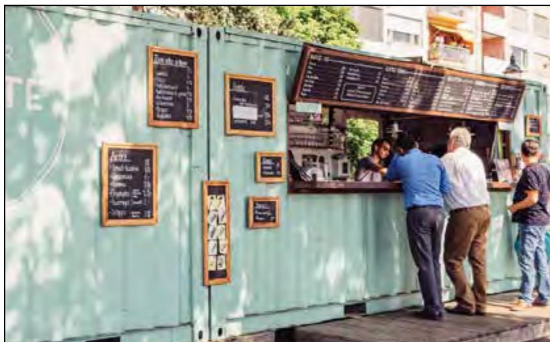
https://www.hotellerie-gastronomie.ch/fileadmin/ Exemple de ce qui fait en terme de conteneur-buvette

Nous avons souligné plusieurs points importants à propos de la gestion de la buvette dans l'objectif qu'elle respecte l'éthique du projet et s'inscrit pleinement dans les critères du développement durable :