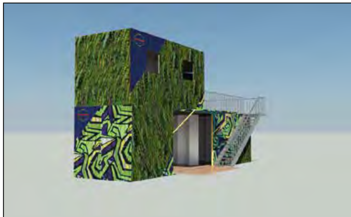
Simulation des façades Sud et Ouest