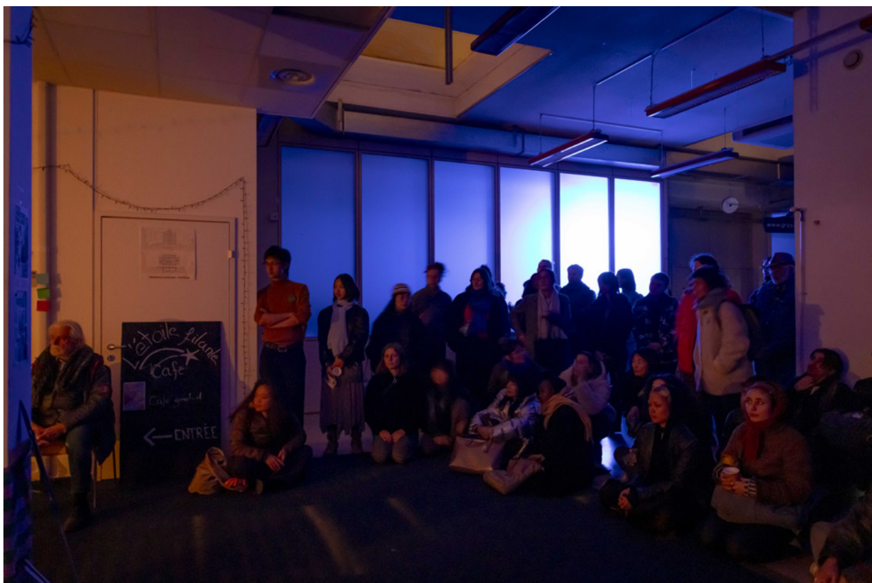
édition 2025 de la résidence

Ce livrable constitue une trace du travail mobilisable pour nourrir la réflexion citoyenne sur ce territoire. A cette fin, il sera partagé avec les autorités publiques impliquées dans le projet PAV et les autres acteur·trice·x-s concerné·e·x-s par la proposition. Il sera aussi inclus dans une publication de l'édition 2026 de la résidence, réalisée par CITÉ.