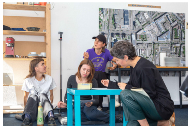
édition 2025 de la résidence, photos © Raphaëlle Mueller