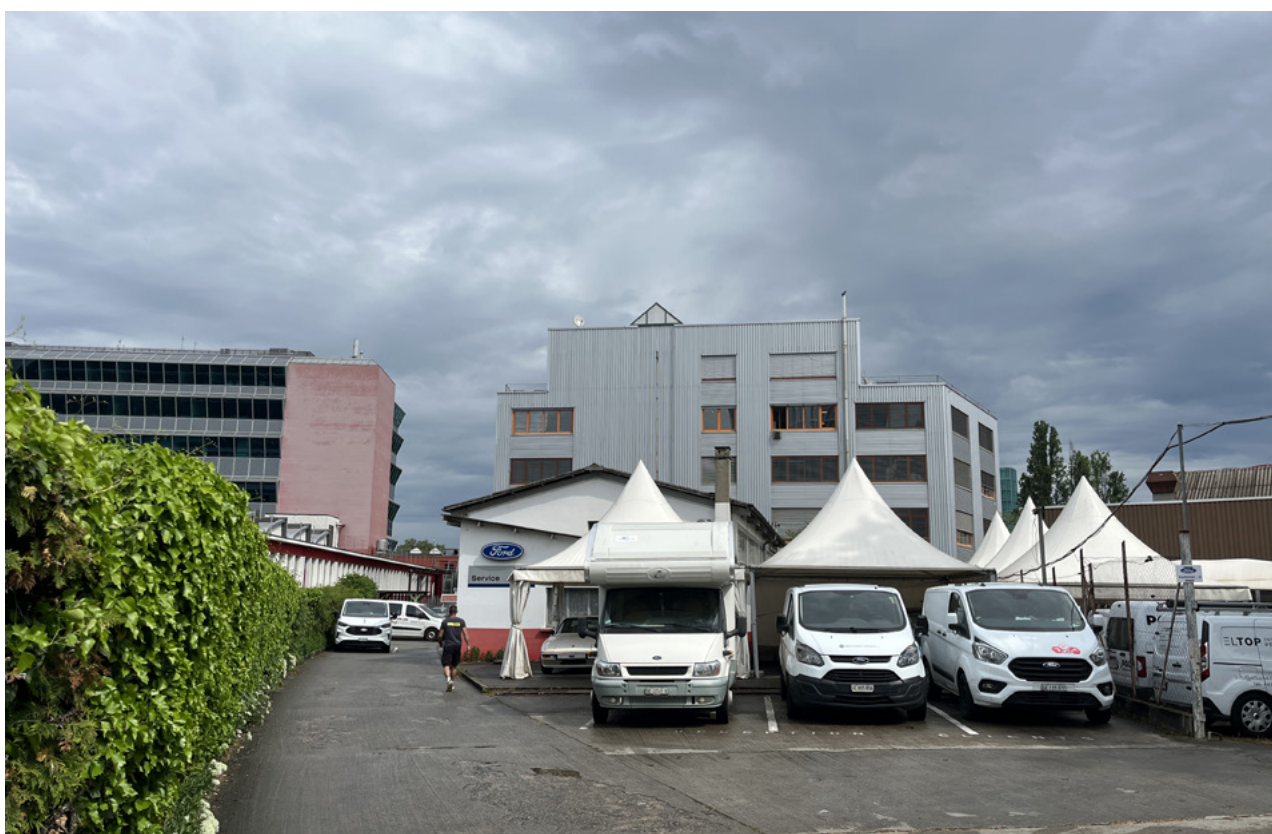
site de l'édition 2026 de la résidence, photo © Aurélie Dupuis

Les résident-e-x-s sont notamment invité-e-x-s à mettre à profit leur présence sur le site pour expérimenter des modes de cohabitation entre les publics et les programmes et développer des imaginaires et des pratiques qui prennent en compte la dimension collective de ce territoire.