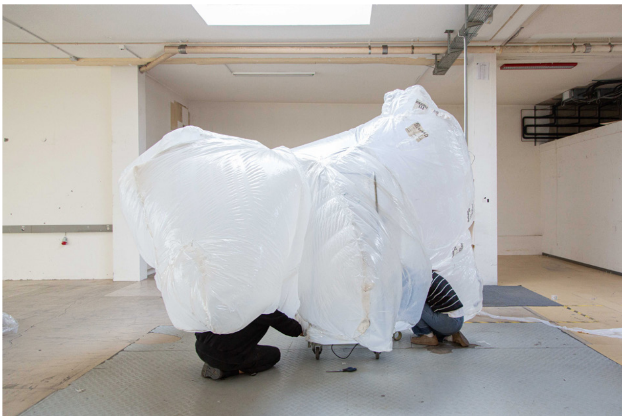
édition 2025 de la résidence