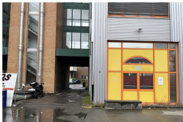
site de l'édition 2026 de la résidence