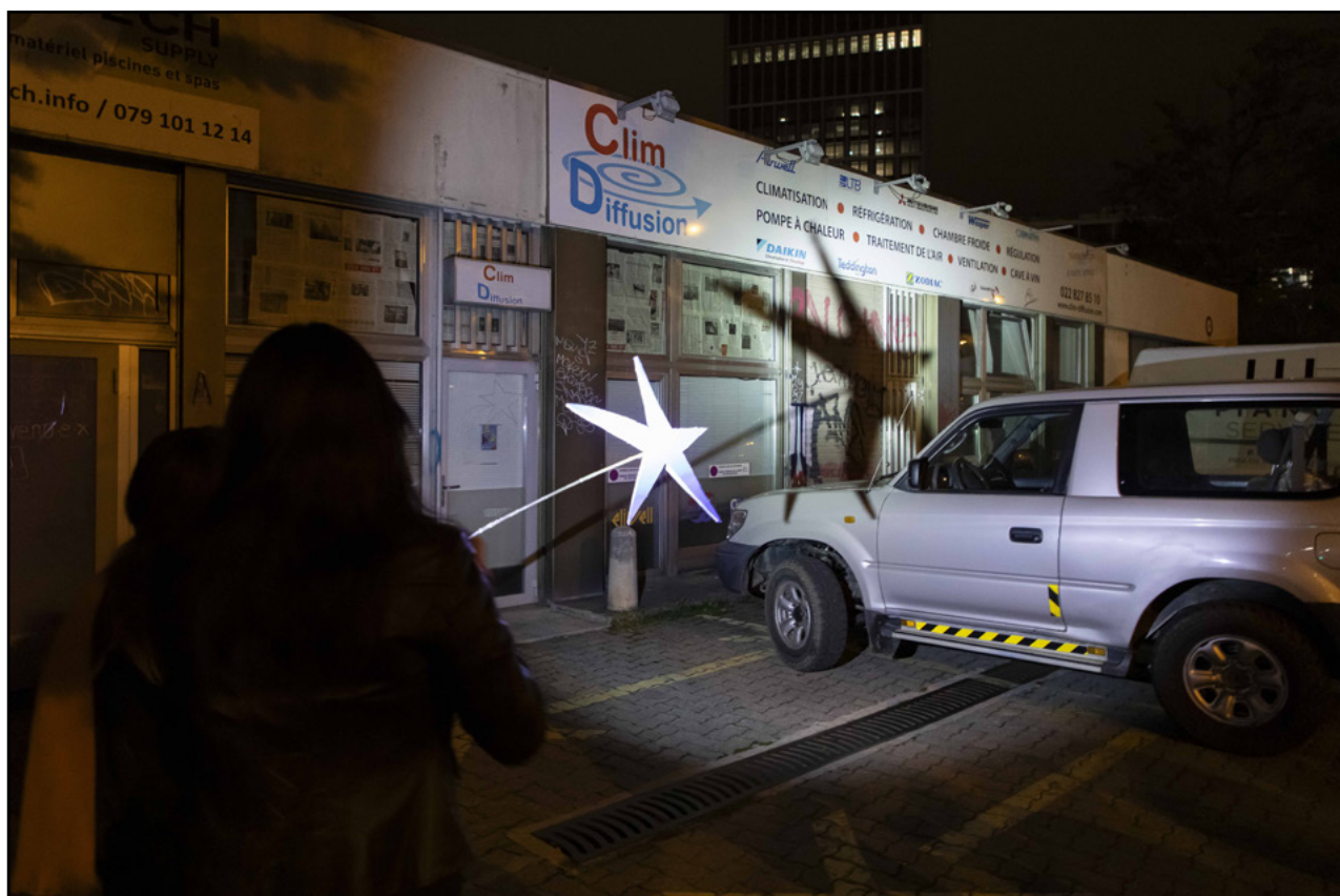
édition 2025 de la résidence

La restitution publique, organisée et scénographiée par les résident·e·x·s, a rassemblé une centaine de personnes pour une déambulation à travers le P+R et une soirée performative et festive à la découverte des propositions au 50, avenue de la Praille.